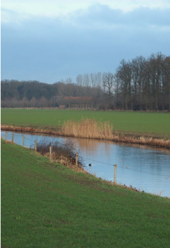
Beeld op Kromme Rijn bij Werkhoven