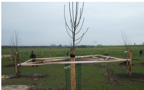
Hoogstamfruit met ezel- en ponybescherming