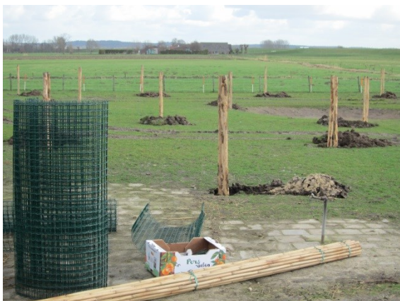
Materiaal voor aanplant hoogstamboomgaard