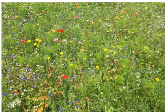
Bloemenveld waar eerst gazon was

Stuurgroep Kromme Rijnlandschap is een samenwerkingsverband van zes gemeenten voor natuur en landschap in het Kromme Rijngebied. Het samenwerkingsverband bestaat al sinds begin jaren zeventig en is destijds opgericht om de zogenaamde “stille recreatie” in het gebied te bevorderen. Tegenwoordig wordt steeds meer ingezet op behouden en verbeteren van ruimtelijke kwaliteit in de breedste zijn van het woord. Naast de participerende gemeenten zijn ook een aantal adviesorganisaties vertegenwoordigd. Op deze manier is een echt (gebieds)gerichte afstemming en samenwerking mogelijk voor het natuur- en landschapsbeleid.