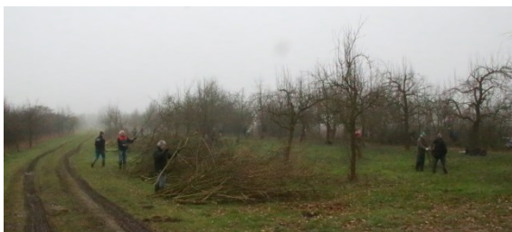
Vrijwilligers aan het werk in Odijk