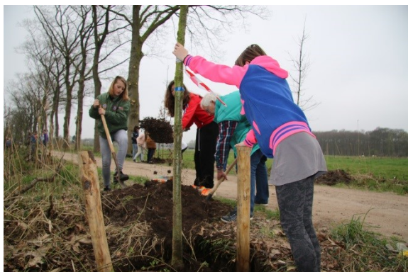
Boomplantdag langs De Striip