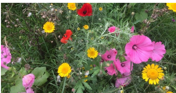
Bloemen uit het zaaimengsel van de beedeals