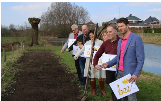
Tekenen Beedeals ondersteund met zaaiactie