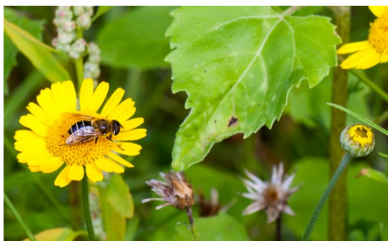
Zweefvlieg op gele ganzenbloem