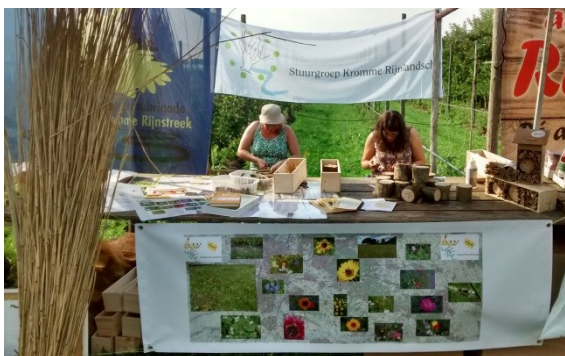
Beedeals kraam op het oogstfeest in Cothen