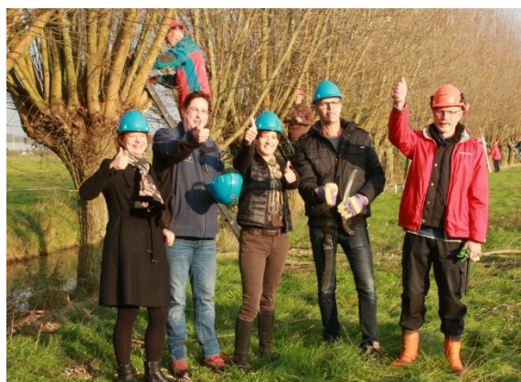
Startsein knotseizoen op de grens Bunnik - Houten