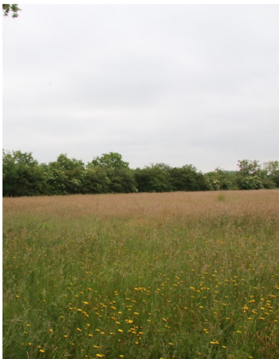
Kruidenrijk hooiland Krommerijnstreek