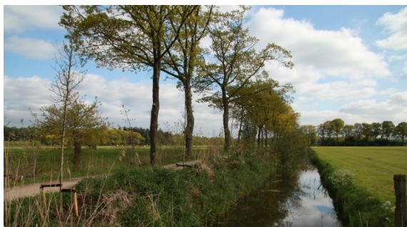
De Strijp in Langbroek