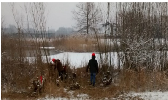
Winterwerk aan een poel in Odijk