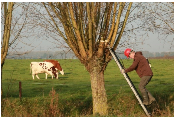
Te knotten wilg op de grens Bunnik - Houten