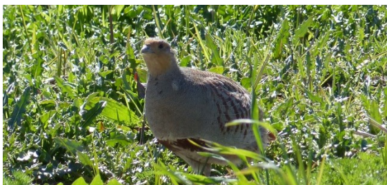
Patrijs op akker